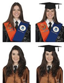
(ejemplos visuales de las vestimentas)

* ¡A elegir! con uno de los vestuarios que ofrecemos